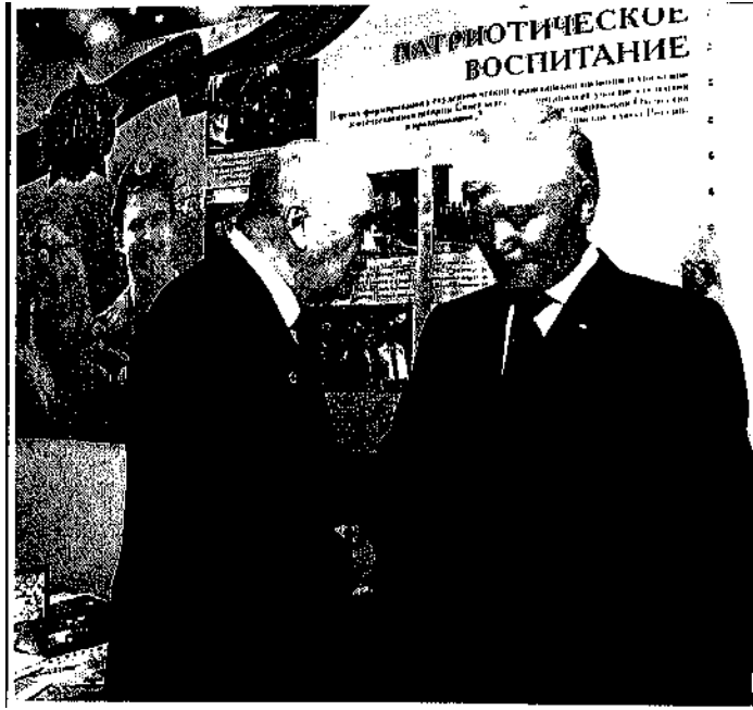
Разговор о героических традициях и семейном воспитании.