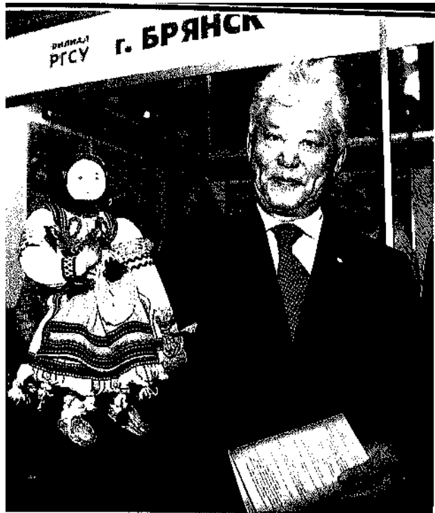
Это может делать каждая семья.