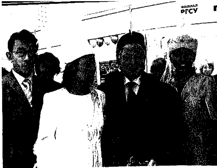
Национальный костюм - символ народных традиций.