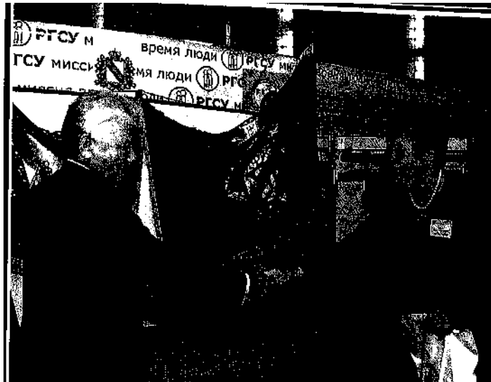
Слова благодарности Курскому филиалу Национального общественного комитета "Российская семья".