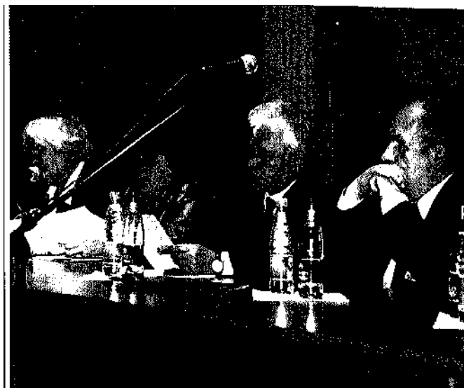
В президиуме IV Всероссийского конгресса "Российская семья".