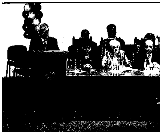
Президиум IV Всероссийского конгресса "Российская семья".