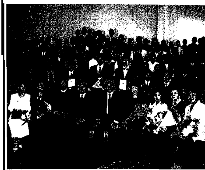
Среди юных дарований Якутии.