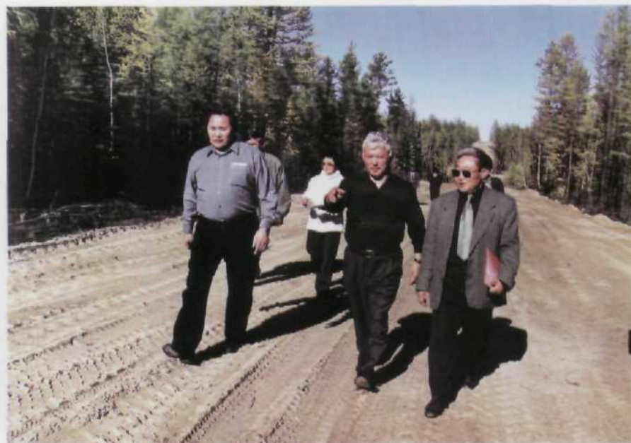
Ознакомление с ходом работ на месте