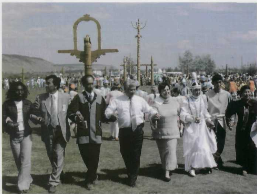
Национальный праздник ысыях. Среди гостей — участники Международной конференции