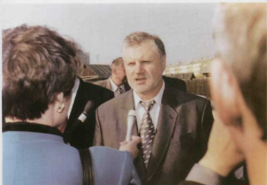
Интервью С.М.Миронова представителям СМИ Якутии