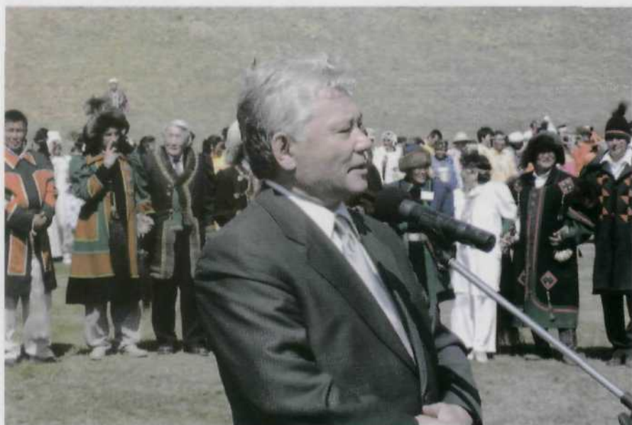
Приветственное слово к участникам праздника