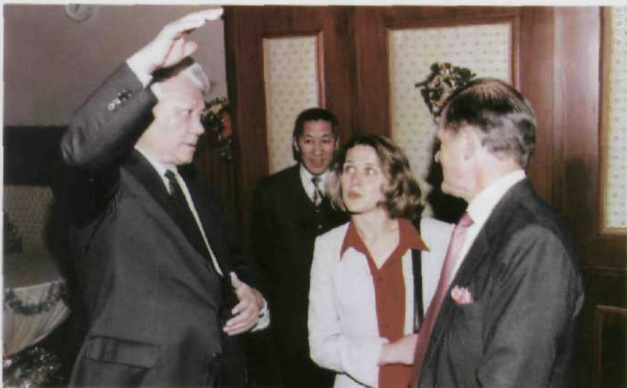
Убедителен в доводах