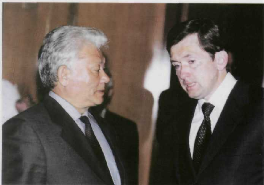
Беседа с российским министром А.П.Починком