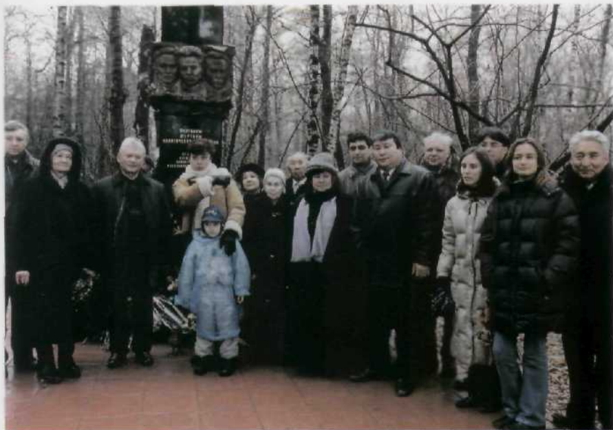
На открытии памятника жертвам политических репрессий 30-х годов в Подмосковье