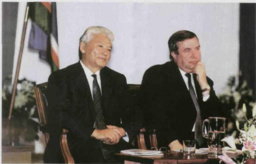
С Председателем Государственной Думы Российской Федерации Г.Н.Селезневым