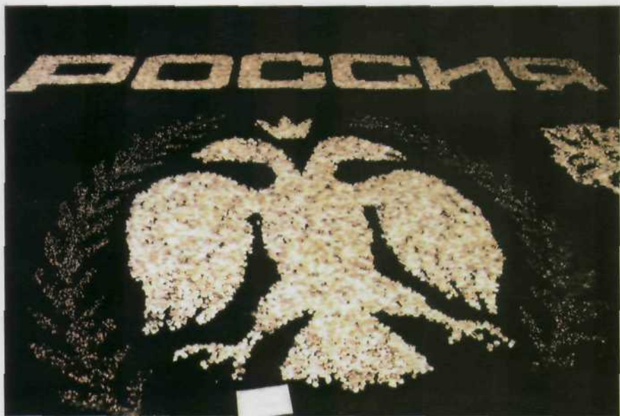
Экспонат из добытых в республике алмазов, выставленный в связи с юбилеем — 370-летием вхождения Якутии в состав Российского государства