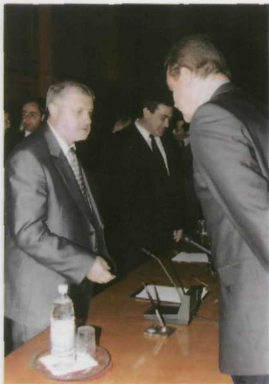
Дни Совета Федерации Федерального Собрания Российской Федерации в Якутске. Встреча Президента РС(Я) В.А.Штырова с Председателем Совета Федерации С.М.Мироновым