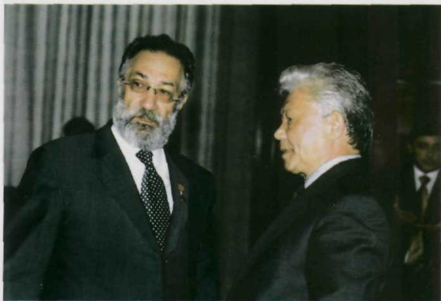
Вице-спикеры палат Федерального Собрания РФ А.Н.Чилингаров и М.Е.Николаев