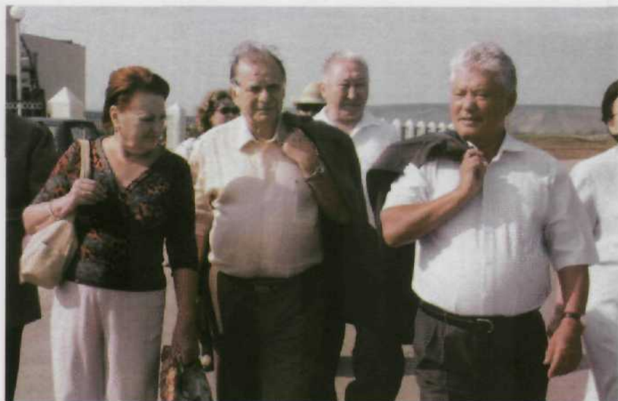
С лауреатом Нобелевской премии, академиком Ж.И.Алферовым