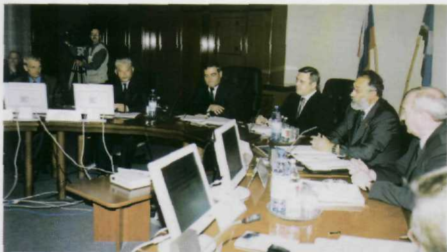
Заседание Комиссии по развитию северных регионов России в Якутске под председательством Председателя Правительства РФ М.М.Касьянова