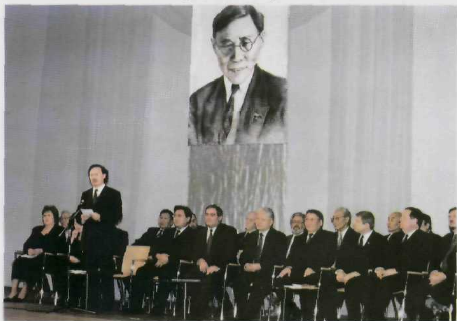
В президиуме торжественного заседания, посвященного 110-летию со дня рождения П.А.Ойунского