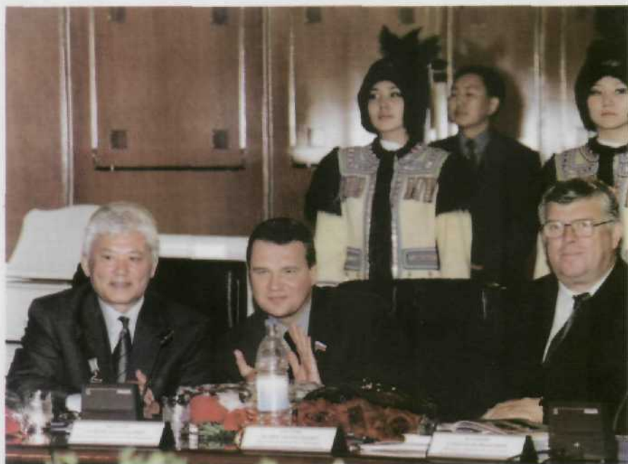
Сенаторы в Якутске