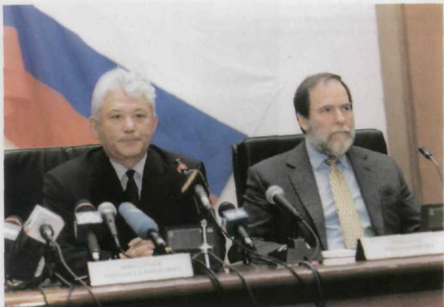
С президентом ТНК "Де Бирс" Николасом Ошпенгеймером, старейшим алмазным королем

Всегда близкий сердцу якутян город Якутск