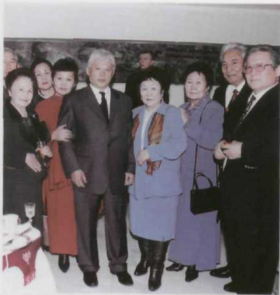
Встречи в Якутске