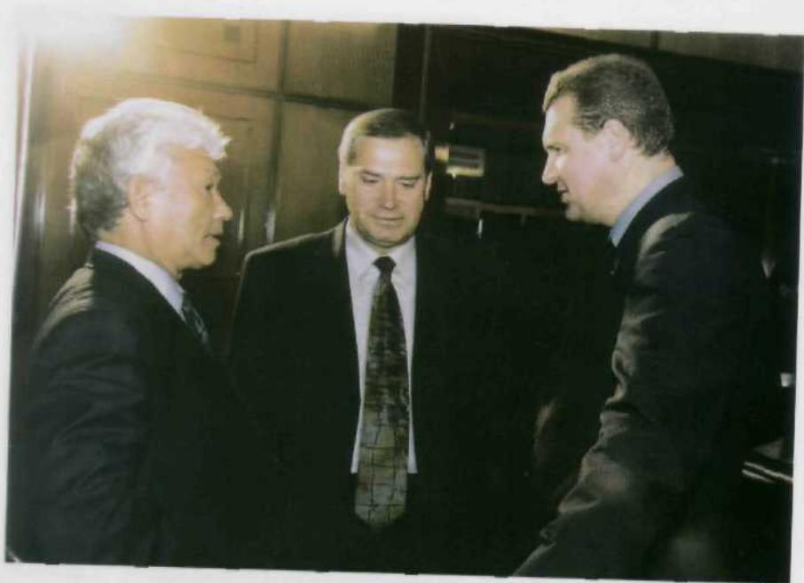
Сенаторы в Якутске